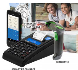
JSMART RT CONNECT