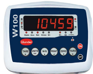
W100VISORE A LED ROSSI MULTIFUNZIONE OMOLOGATO