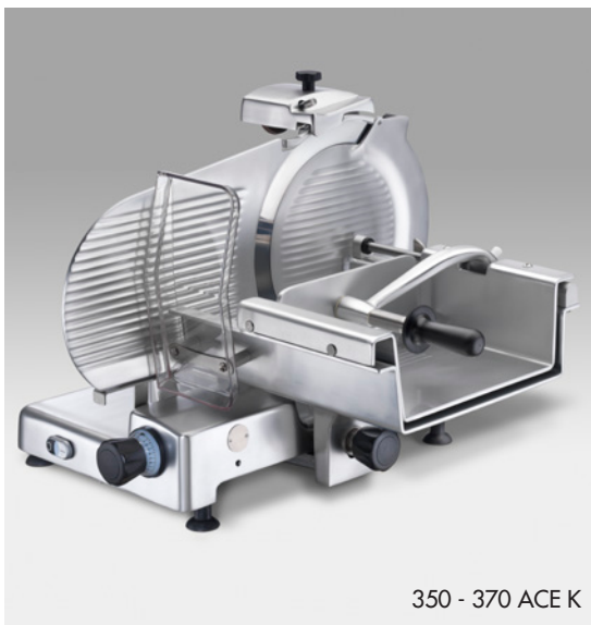
350 - 370 ACE K