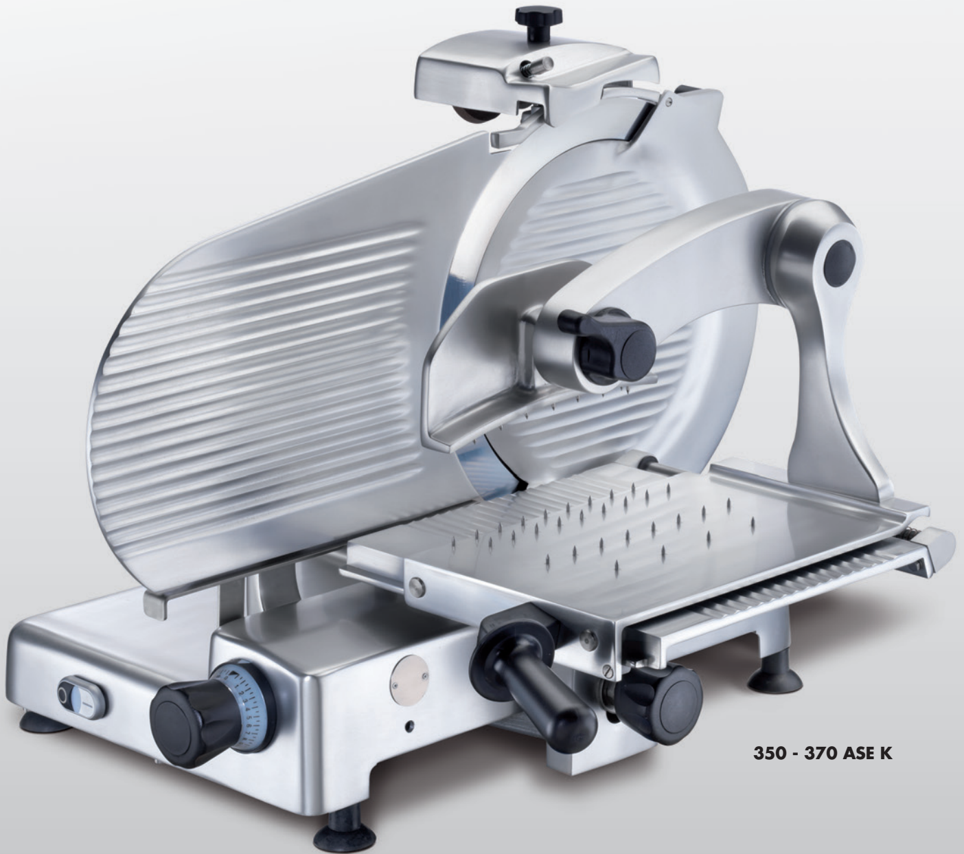
350 - 370 ASE K