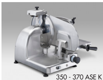
350 - 370 ASE K